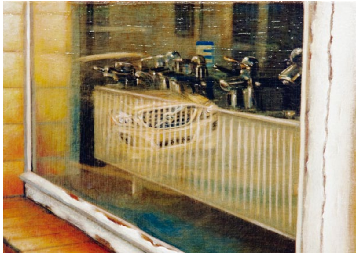
DAS WERK Metulczkis Ladenfront repräsentiert die alte DDR, während sich im Schaufensterglas schon die Zukunft abzeichnet: Der Volvo XC60 spiegelt sich im Glas