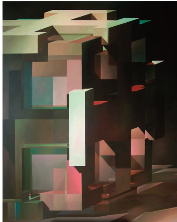
Kreuzwürfel V | 2008 | Acryl auf Leinwand | 160 x 130 cm

imaginäre Licht- und Schattensituationen, klare architektonische Formen mit ornamentalen Strukturen.