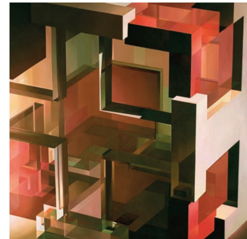
Kreuzwürfel IV | 2006 | Acryl auf Leinwand | 180 x 180 cm | Privatsammlung Barcelona

Durch die sich überlagernden Transparenzen gewinnen die einfachen Objekte an Komplexität; im Zusammenspiel mit Licht und Schatten entstehen dabei neue Formen, ornamentale Strukturen, die sich von den Körpern loszulösen scheinen und nicht nur das Spannungsverhältnis Fläche und Raum betonen, sondern auch als Lichtfleckenornamente auf dem Boden die Bildfläche rhythmisieren.