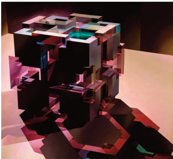
großes Würfelkreuz | 2006 | Acryl auf Leinwand | 220 x 240 cm

Verschiedene Lichtquellen treffen im Bild aufeinander, so dass sich Schattenstrukturen überlagern, manche Lichter werfen keine Schatten, mancher